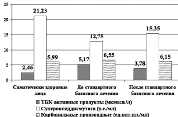
Рис. 3. Показатели системы свободнорадикальное окисление – антиоксидантная защита у больных 3 группы исследования до и после лечения ( M \pm m ).

У больных третьей группы, получавших на фоне стандартной базисной терапии препарат Элтаксин (рис. 3), после проведенной терапии уровень ТБК-активных продуктов статистически значимо снизился ( W > 1,96 ),